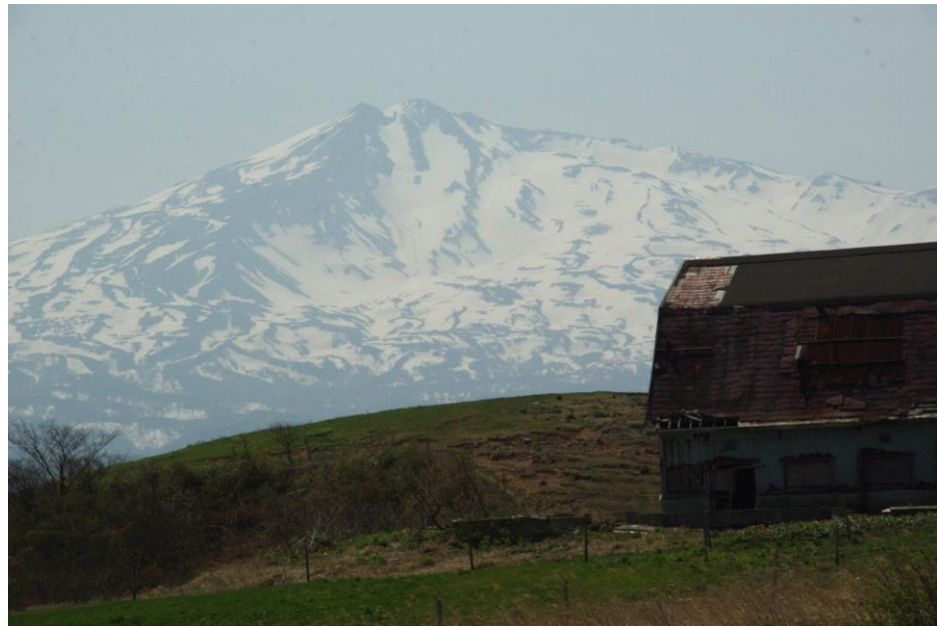
にかほ高原の土田牧場より鳥海山を望む

*みずほ総合研究所「消費税率引き上げに伴う家計負担」(2013年10月)より 総務省「家計負担」から試算