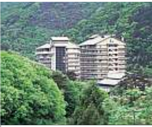
磐梯熱海温泉ホテル華の湯

騎西事務所前に時間までに集合をお願いします。駐車場の関係で乗合で来るようにして下さい。梅雨に入り天候が心配されますが、見学場所などがあるので、雨天の場合に備えて雨具の用意も考えておきましょう。研修の資料は今回は紙面になります。交流会は磐梯熱海温泉で開催します。