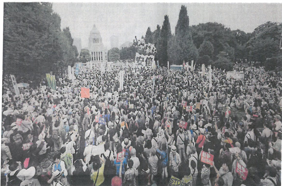
戦争法案NO！ 8月30日国会前に12万人怒りの包圍