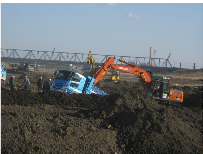
土の降ろし場で穴に落ちたダンプ

運転中は勿論ですが、現場場内でも携帯電話や脇見運転などをしないようにしましょう。自分が怪我しても、ましてや他人に怪我を負わしたら大変な事になります。旅は家に帰るまでが旅だと言いますが、仕事も同じです。家に帰るまで仕事は終わりません。 最近では信号や横断歩道を渡っていた学童の死亡事故やお年寄りの事故のニュースが多くなっています。気を抜かないように安全に一日を過ごしましょう。