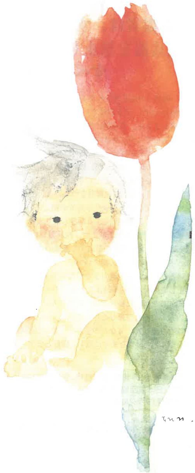
いわさきちひろ チューリップとあかちゃん (1971年)