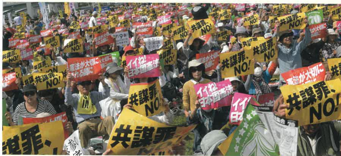
2017年「施行70年、いいネ！日本国憲法5・3集会」5万5000人参加（東京・有明防災公園）

“安倍9条改憲”反対の一点で手をつなぎましょう。3000万人の「戦争はイヤだ」の声を集めて、9条を未来につないでいきましょう。