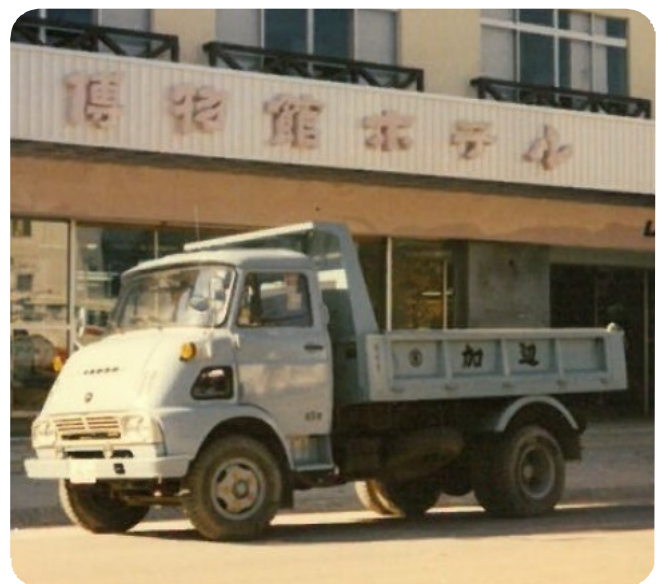
昭和40年代の愛車いすゞ「TY51」