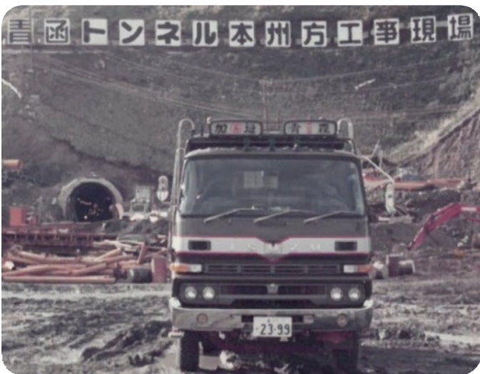
いまや新幹線も走る青函トンネル。多くの労働者が殉死した難工事でもありました。

「本当はあと二三年は仕事をしたかった。家族が反対するんで、いろいろあつたけど事故の加害者になった。それは一度もなかった。それが一番、組合に入ってお世話になりました。みなさんお元気で」