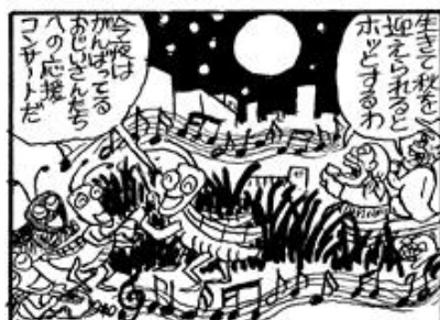
低所得者ほど格別な季節である