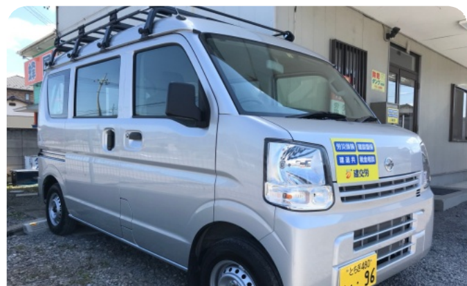
税金未納からエコ宣伝カー購入という見事な展開(^_^)

昨年5月、初度登録から13年を経過したことを理由に自動車税を51000円加算した県の決定に納得できず、納付を拒否し審査請求(不服申し立て)を行いました。 3月26日、ようやくその判決が下されました。 「主文、本件審査請求を棄却する」、理由は要するに「国の決めたことだから」それだけ。 結果は予想通りで、税金未納からエコ宣伝カー購入という見事な展開(^_^)