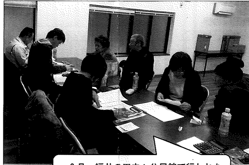
2月、福井の田中々公民館で行われた税金計算会に参加した組合員

昨年は、大雪による排雪作業に加えて、北陸新幹線トンネル工事などが本格稼働し、ダンプ需要が急増、石川や福井を中心にダンプカー不足が深刻化しました。そうした状況を受け、30年は石川、福井の組合員を中心に売り上げ、所得ともに増加している傾向が伺えました。売り上げは、平均で1000万円を超えています。また、所得についても、200万円台半ばが平均値となっています。売り上げや所得が増えれば、当然、税金も増えてきます。心配なことがあれば、組合に相談を。