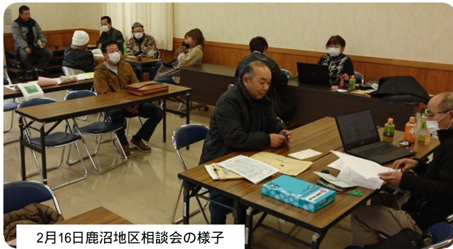
2月16日鹿沼地区相談会の様子

二月から三月十六日 に申し出てください。 まで確定申告相談会を 扶養家族の氏名、生 実施しています。 年月日 【用意するもの】 昨年支払った国民健 康保険、介護保険の 金額 医療費の領収書。同 算書のない人は事務所 がわかるもの。自主計