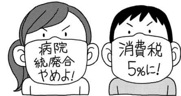
後手後手の末の「荒手」