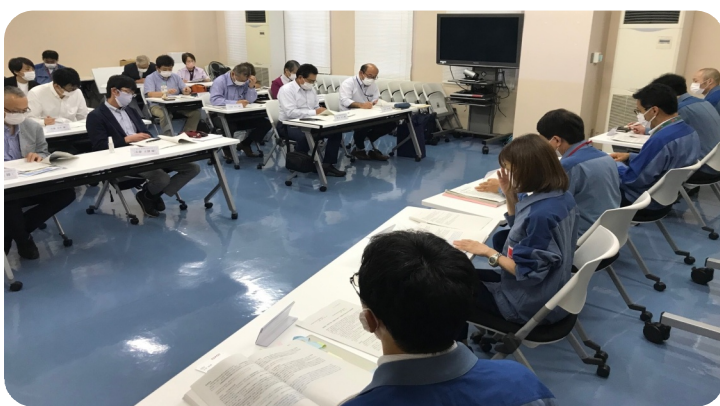
視察後行われた東電への要請。原発作業員に対する労基法違反や労働安全管理問題、汚染水放出撤回について要請しました。手前が苦しい答弁を繰り返す東電社員。

ブリが残されており、海からのテロ攻撃などを防衛できるのか不安になります。ウクライナ情勢でも明らかかなように、原発の存在自体が脅威になります。