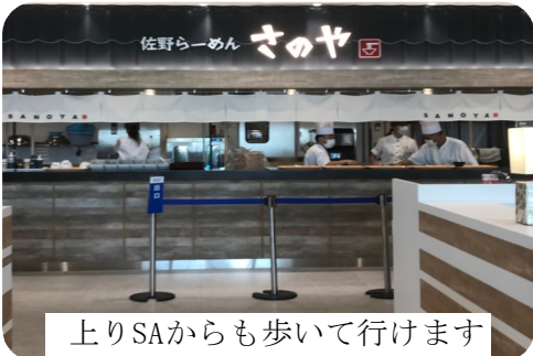
上りSAからも歩いて行けます

ラーメン800円(税込)。麺は手打ち風。スープは「鶏、豚、カツオ、サバ、イワシなどからエキスを抽出」しているそうです。しかし絶対お客さんが入る場所なんだから、ここは名物青竹手打ち麺で勝負してほしかった。