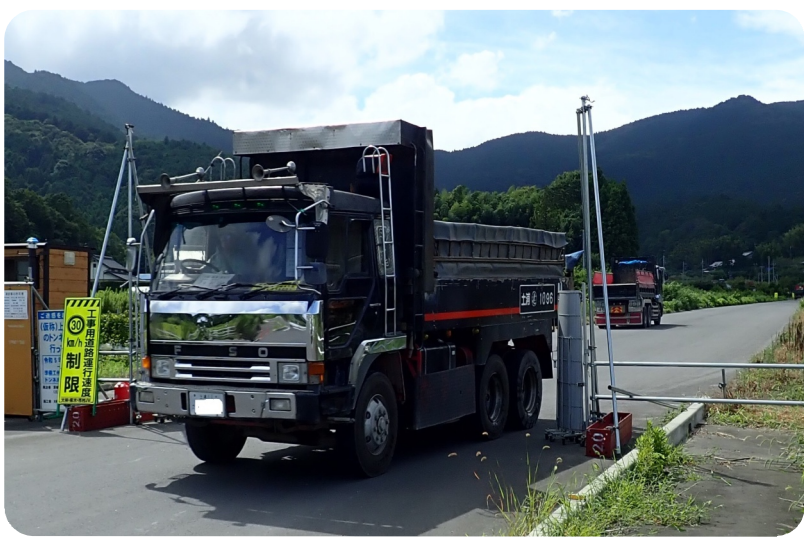
上曾トンネル現場。単価が下がっても運搬回数は同じです。

称して、閑散期になると単価を一方的に下げられる傾向が見られます。弱い立場の職人やダンプは仕事をつなげるために泣く泣く従わざるを得ません。