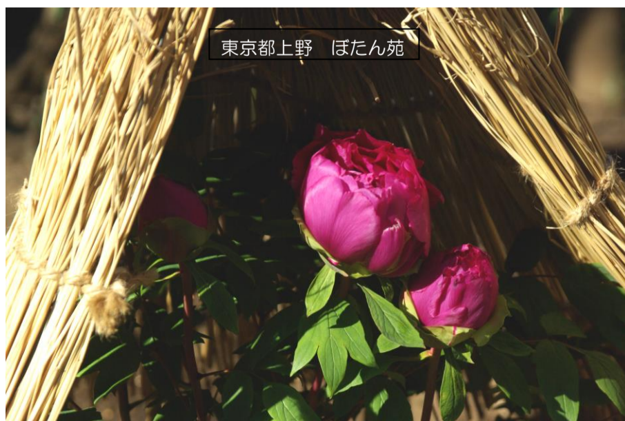
東京都上野 ぼたん苑