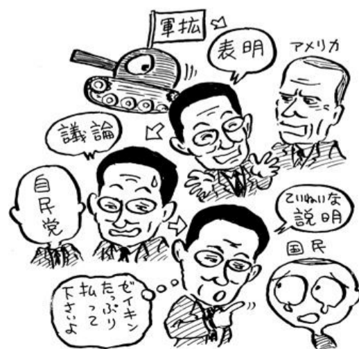
主権は米国にあり