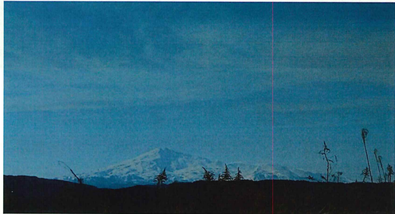
秋田県由利本荘市より鳥海山を望む

年度変わりで労災保険の加入コースを見直したい方は、下の表を参照して3月20日までに各県の事務所までお知らせください。まだ未加入の方は、ご検討ください。