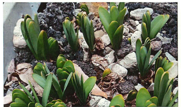
アスファルトを破ってナツズイセンの芽が出てきた

引き続き学習会などの集会を組合員はもちろん、組合に未加入の人もふくめ持ちたいと考えています。組合事務所または各専従までご連絡ください。